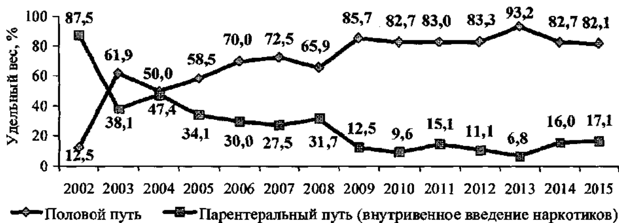
Рисунок 1. Удельный вес путей передачи ВИЧ-инфекции

11-ти случаях (1,3%), в 6-ти случаях (0,7%) - причина инфицирования не установлена.